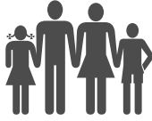
Figura 2 – Procuradoria Jurídica – Processos de Benefícios Previdenciários